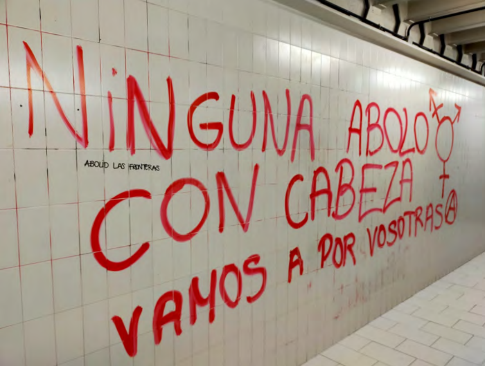
Pintada en la Universidad Complutense el 8 de marzo de 2020.