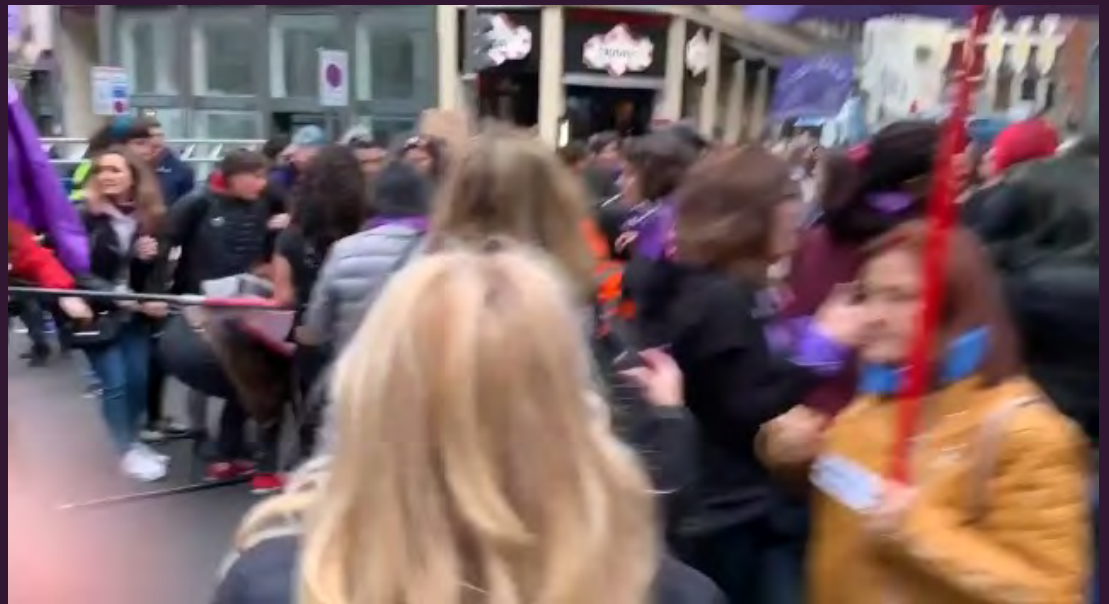
Vídeo: organizadoras expulsan físicamente a Juventudes Feministas