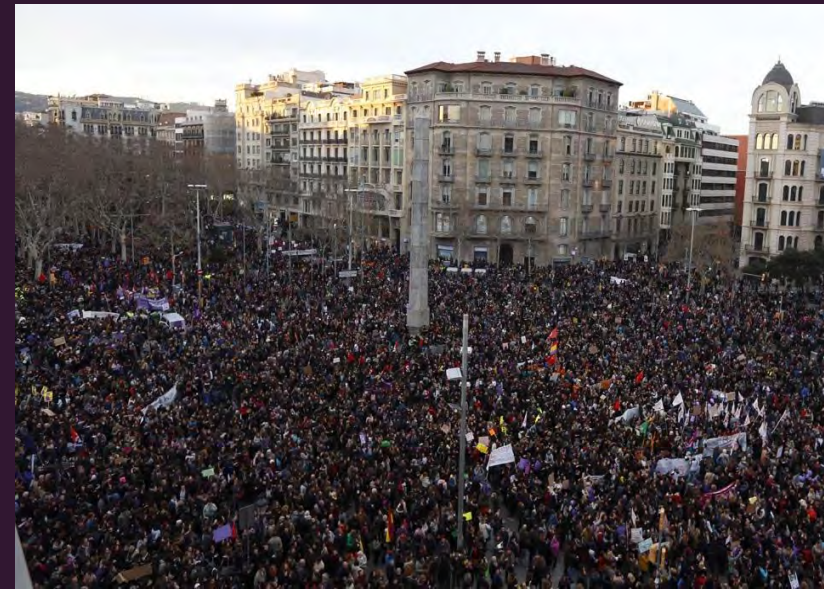
Bilbao (izquierda), Barcelona (arriba) y Madrid (debajo), 2018