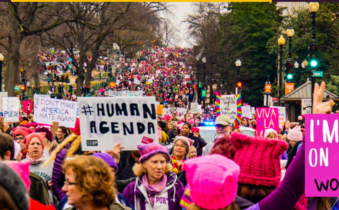
Washington, 21 de enero de 2017