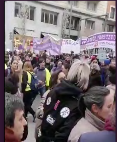
Manifestación del 8M de Madrid.